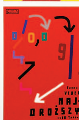
Lech Majewski Queens of Britain, Popular Theatre in Radom, 2011, offset, 98 x 68 cm.